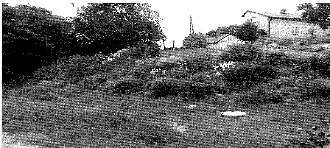
Fot. 7 Działka gminna