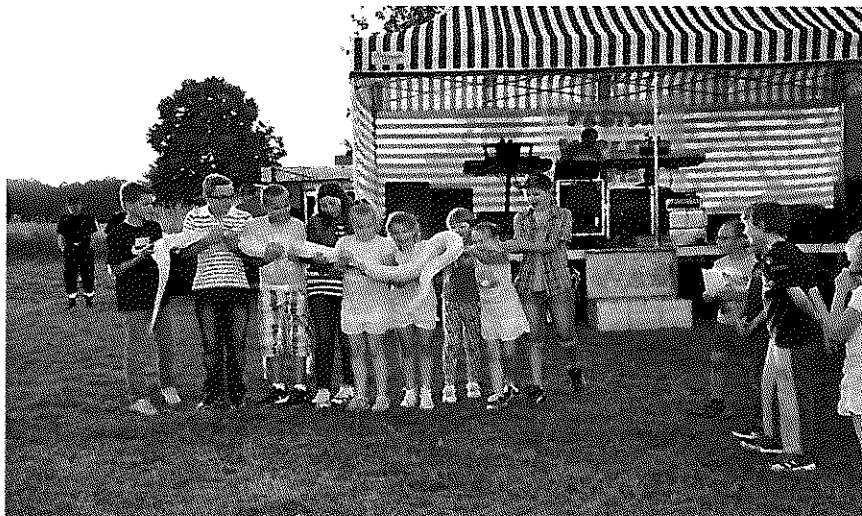
Fot. 4 Festyn integracyjny sołectwa Waplewo