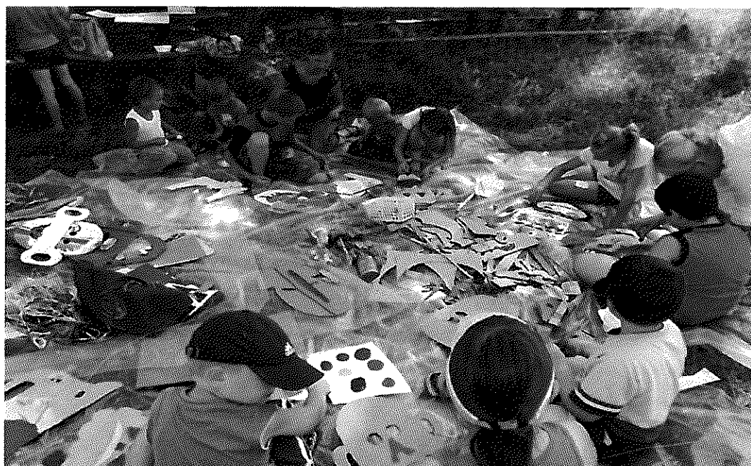
Fot. 5 Zajęcia plastyczne dla dzieci i młodzieży