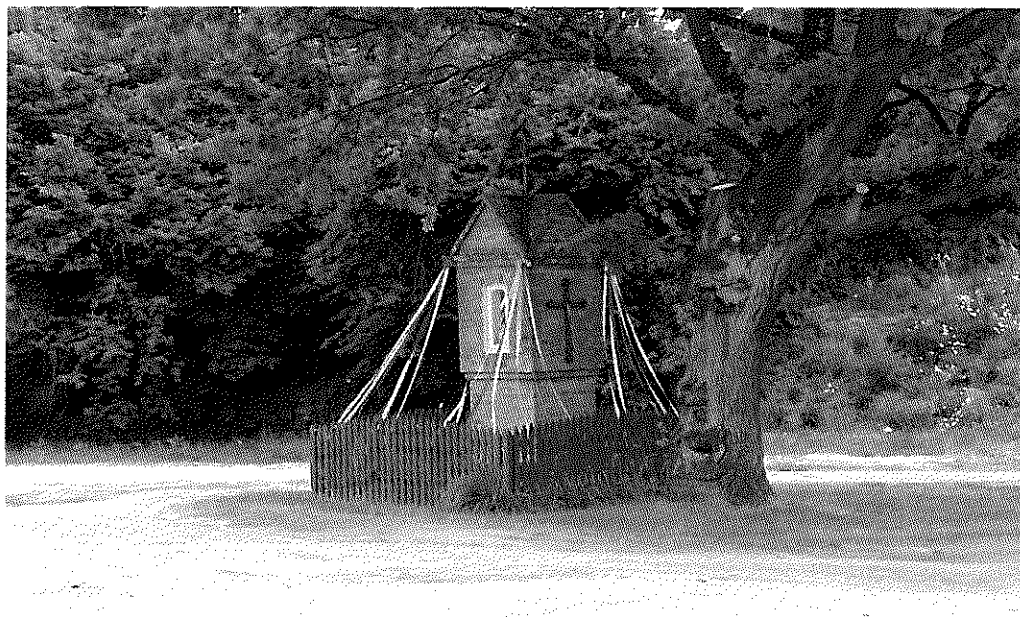
Fot. 6 Kapliczka we wsi Waplewo

Cel 11- Uporządkowanie działek gminnych na terenie sołectwa Waplewo