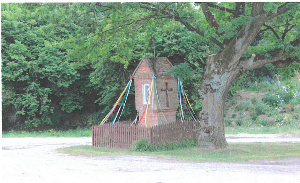
Fot. 6 Kapliczka we wsi Waplewo