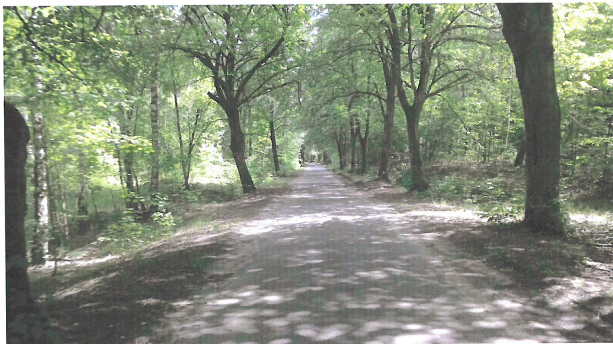
Fot.3 Aleja lipowa

około 190 dni. Pierwsza pokrywa śnieżna może pojawić się już w trzeciej dekadzie listopada, a znika średnio pod koniec pierwszej dekady kwietnia. Bywa, że utrzymuje się nawet 130 dni.