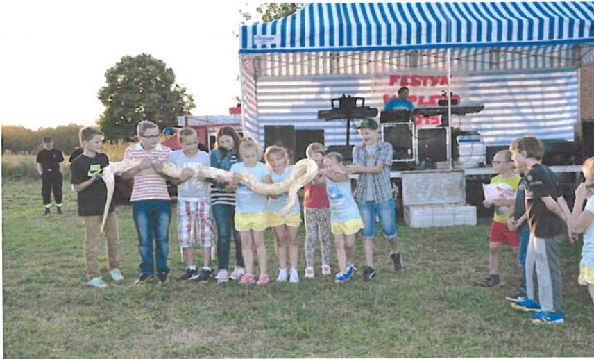
Fot. 4 Festyn integracyjny sołectwa Waplewo