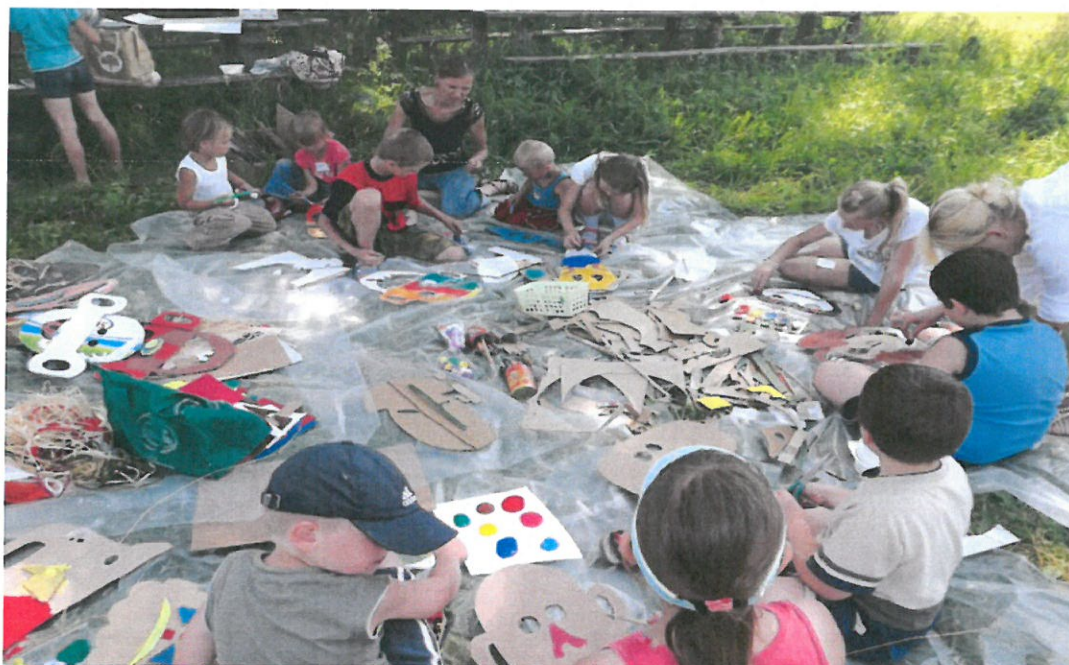
Fot. 5 Zajęcia plastyczne dla dzieci i młodzieży