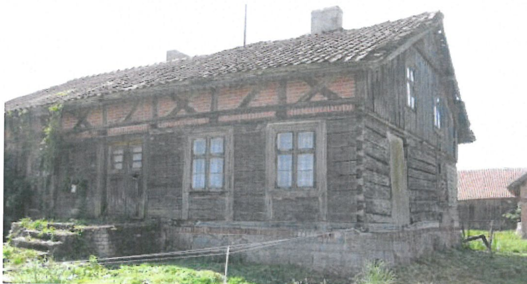
Fot. 2 Drewniana chałupa w Waplewie

Na uwagę turystów zasługuje kapliczka, umiejscowiona w samym centrum wsi. Powstała ona na początku ubiegłego wieku. We wnętrzu budowli znajduje się figurka Matki Boskiej, co można doskonale dostrzec dzięki okienkom umieszczonym z trzech stron. Drewniany krzyż ze zdobieniami w drewnie to przepiękny element dekoracyjny tylnej części kapliczki. Na samej górze