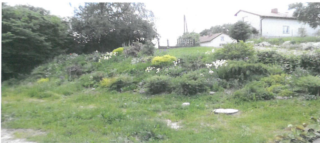
Fot. 7 Działka gminna