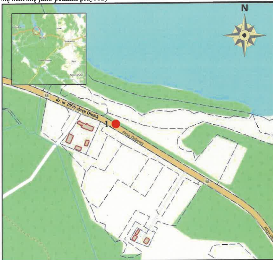
Mapa nr 1

Załącznik nr 2 do uchwały Nr XXVII/170/26 Rady Gminy Jedwabno z dnia 5 maja 2026 r.