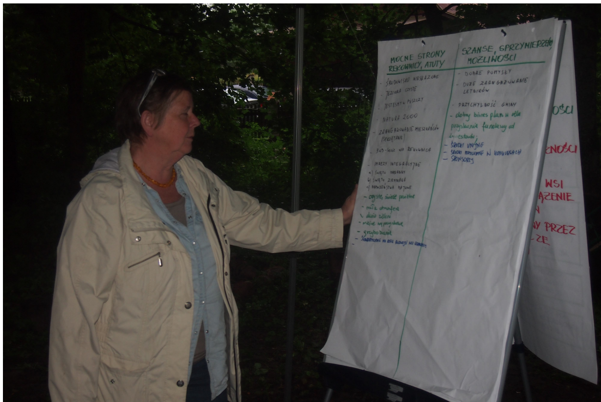
Zebranie wiejskie – 12.07.2014 r. – prezentacja efektów pracy w grupach