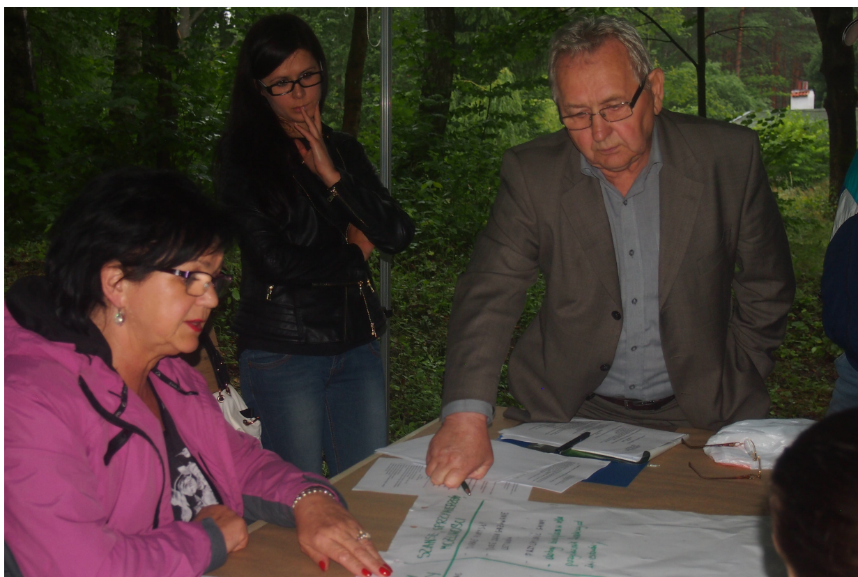
Zebranie wiejskie – 12.07.2014 r. – mieszkańcy pracują nad analizą SWOT