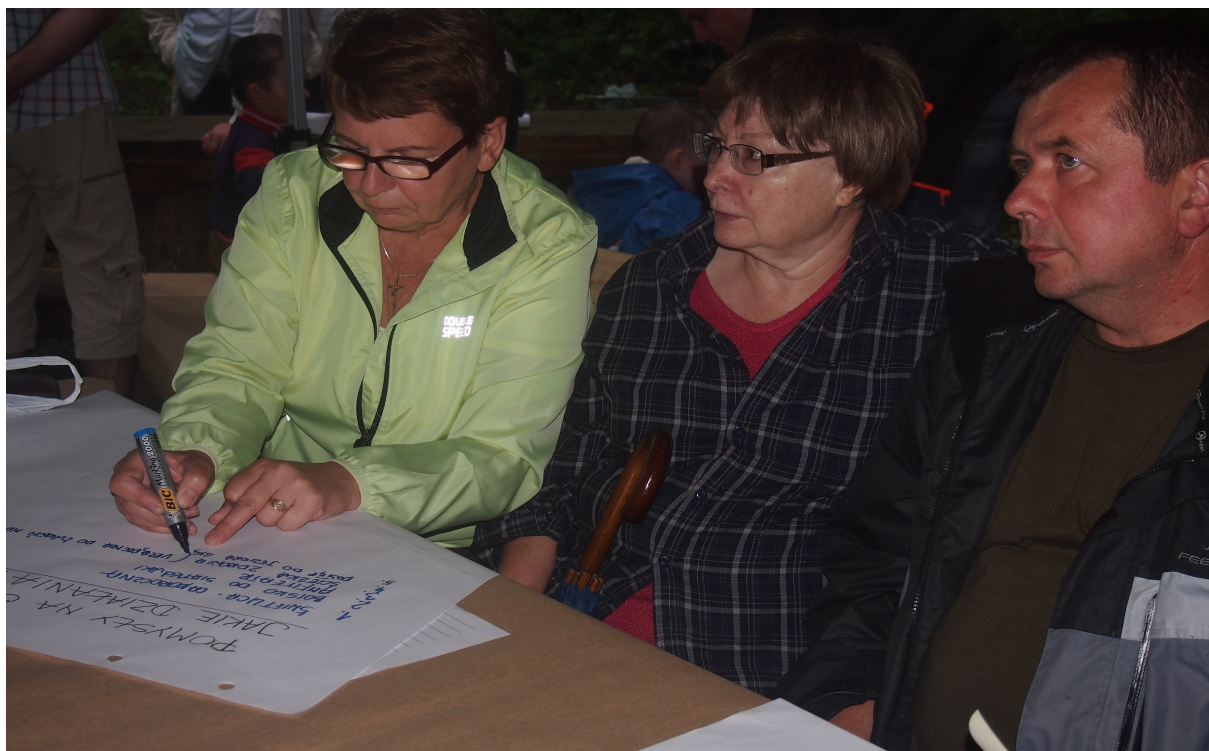
Zebranie wiejskie – 12.07.2014 r. – spisywanie pomysłów na działania.