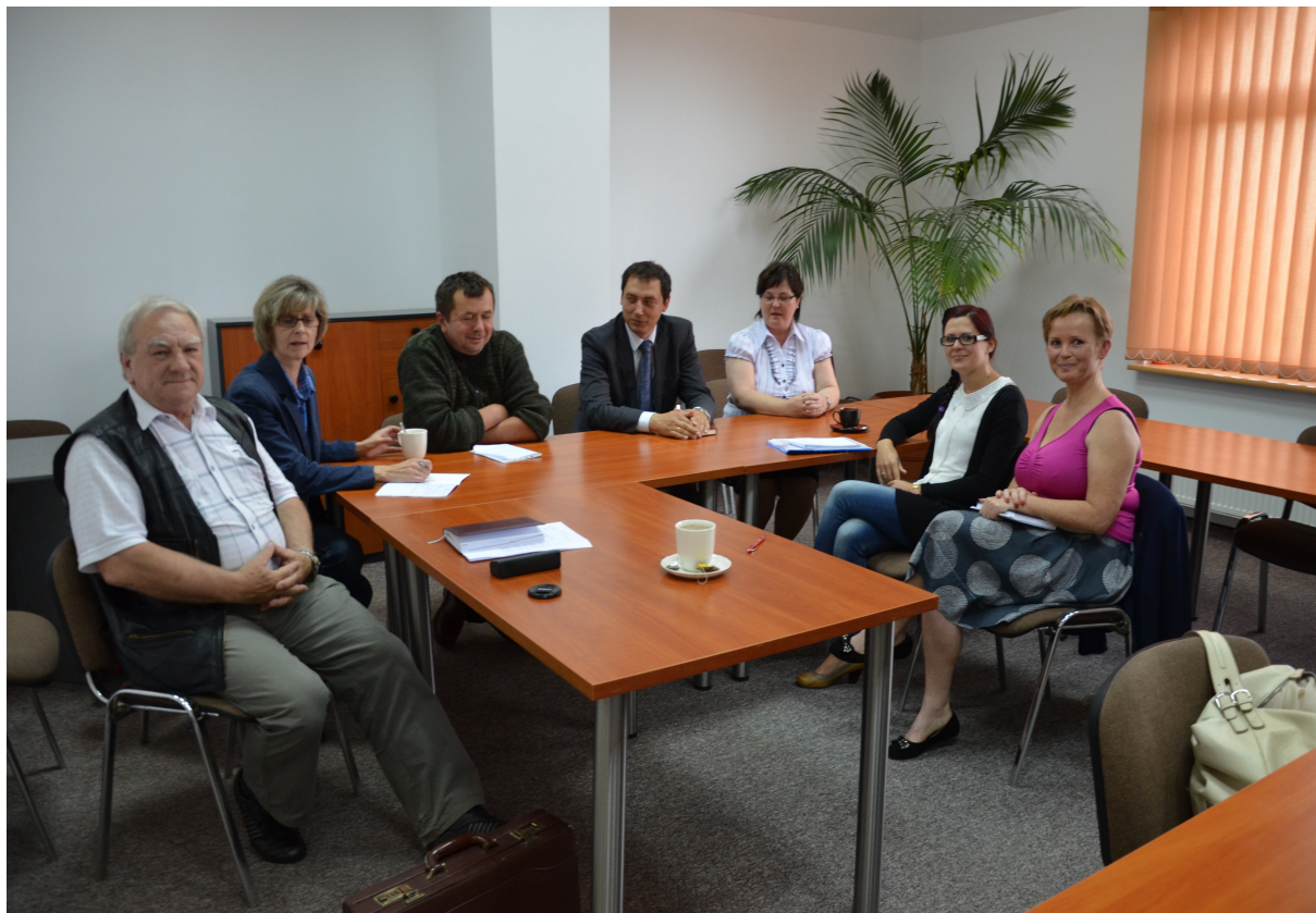
Czerwiec 2014 – pierwsze spotkanie organizacyjne w Urzędzie Gminy Jedwabno