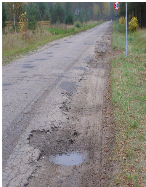
Droga wojewódzka nr 508