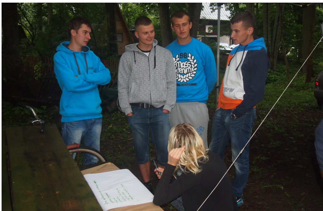
Zebranie wiejskie – 12.07.2014 r. – młodzież zastanawia się jak promować udział sołectwa w programie i zachęcać mieszkańców do pracy nad POM