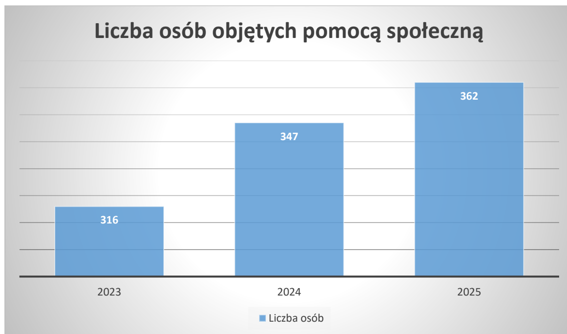
Tabela 4: Liczba osób objętych pomocą społeczną w latach 2023–2025

Analiza danych wskazuje na systematyczny wzrost liczby osób objętych wsparciem – z 316 osób w 2023 roku do 362 osób w 2025 roku. Tendencja ta może wynikać z kilku czynników, w tym pogarszającej się sytuacji materialnej części mieszkańców, zmian demograficznych oraz rosnących kosztów życia.